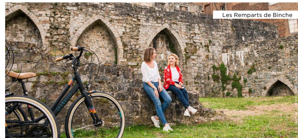
Les Remparts de Binche

Au départ de la Grand Place de Binche, ville réputée pour son carnaval reconnu comme «chef d'œuvre du patrimoine oral et immatériel de l'humanité», vous vous dirigez vers le petit village rural et calme d'Estinnes-au-Val. Quelques kilomètres plus loin, au fil de l'eau, vous serez impressionné par l'ascenseur funiculaire de Strépy-Thieu et les ascenseurs hydrauliques de l'ancien canal, classés au patrimoine mondial de l'UNESCO. Sur le chemin du retour, ne manquez pas la visite de l'ancien site minier du Bois-du-Luc avant de rejoindre votre point de départ, Binche, par le RAVeL.