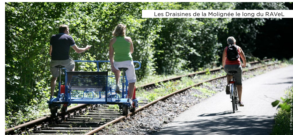
Les Draisines de la Molineée le long du RAVeL